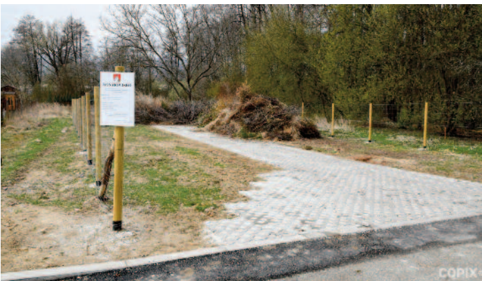
vybudované oficiálne konárovisko