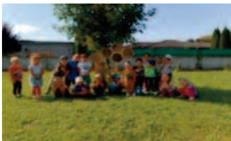
MATERSKÁ ŠKOLA PRAVENEC a NADÁCIA VOLKSWAGEN SLOVAKIA

Ako riaditeľka materskej školy som sa zapojila do projektu zamestnancov Volkswagenu, kde Nadácia Volkswagen Slovakia posúdila môj projekt v oblasti vzdelávania ako úspešný. Materskú školu podporila sumou 2 000 eur, za ktoré sa nakúpia pomôcky na vyučovanie v oblasti environmentálnej výchovy.