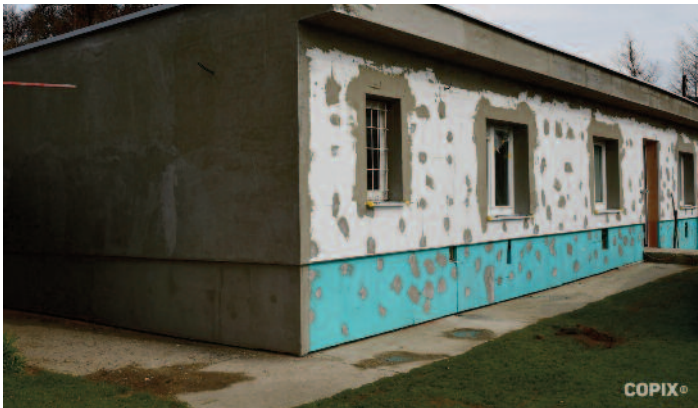
rekonštrukčné práce na šatniach FO oddielu po požiari