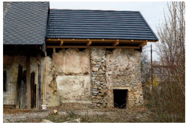
oprava časti strechy na Kúrii a úprava príslahých plôch