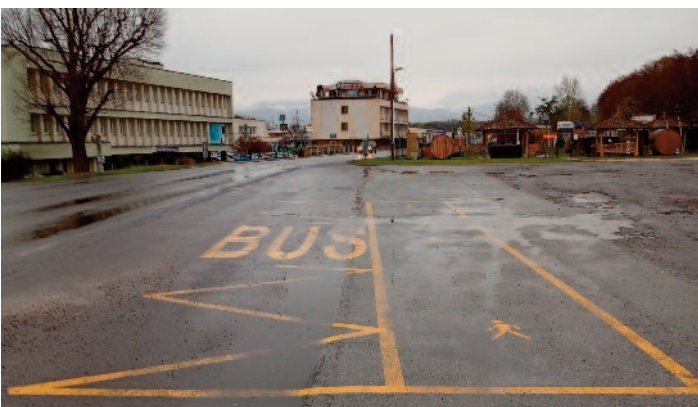
zvýšenie bezpečnosti pri nástupe na autobusovej zástavke