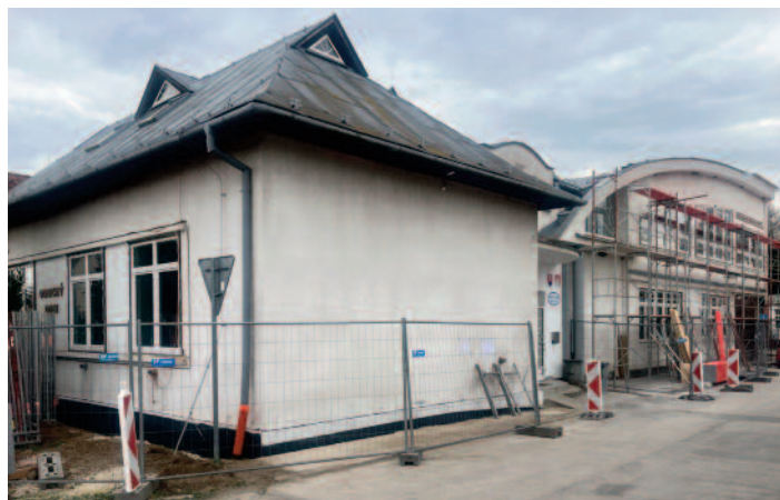
rekonštrukcia obecného domu