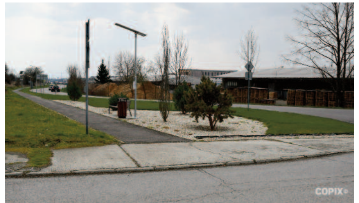
reprezentatívny vstup do obce