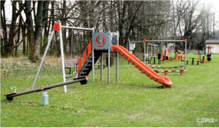
odovzdané do užívania detské a workautové ihrisko