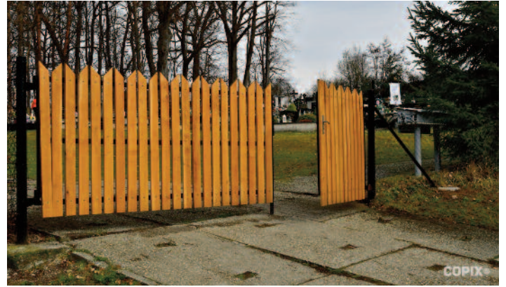
zrekonštruovaný vstup na cintorín