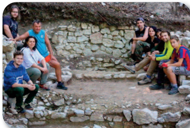
Časť tímu sa nechala "zvečniť" v severnej lodi kostola